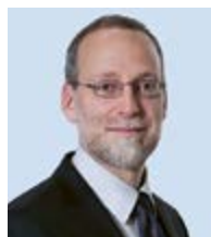
Rolf Zehnder H+ Die Spitäler der Schweiz