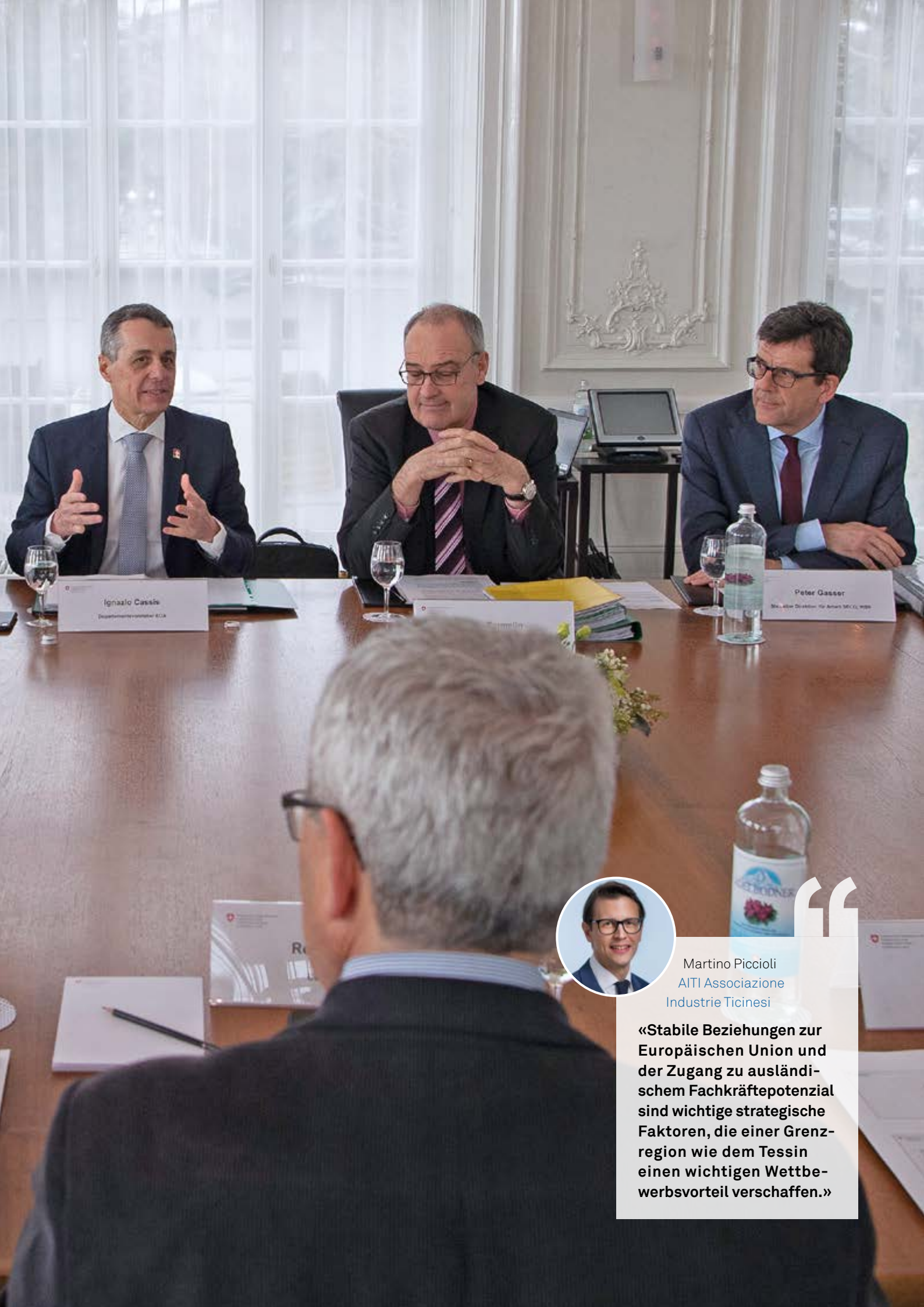
Ignazio Cassin Departementpräsident BLS